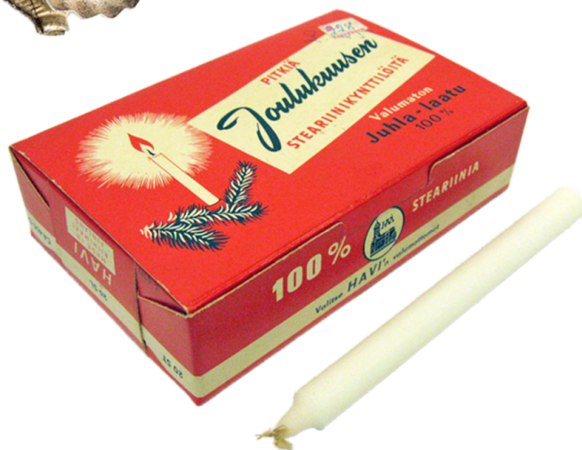
Kuusenkynttilöitä ja kynttilänpitimet

Edelleen lapset ja joulumieliset aikuiset askartelevat kuusenkoristeita. Varsinkin lasten tekemiä joulukoristeita säilytetään hellästi ja huolellisesti pakattuna joulusta toiseen. Laatikoissa voi olla myös suvun vanhoja koristeita, jotka aina jouluaattona löytävät tutun paikkansa kuusen oksilta ja muistuttavat läheisistä.