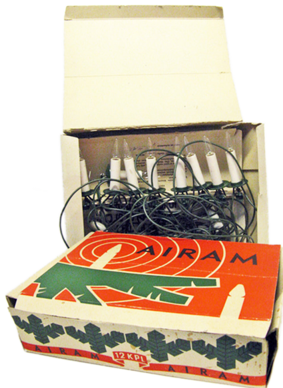
Airamin sähkökynttilät 1960-luvulta

Millaisia koristeita joulukuusessa oli, kun olit lapsi?