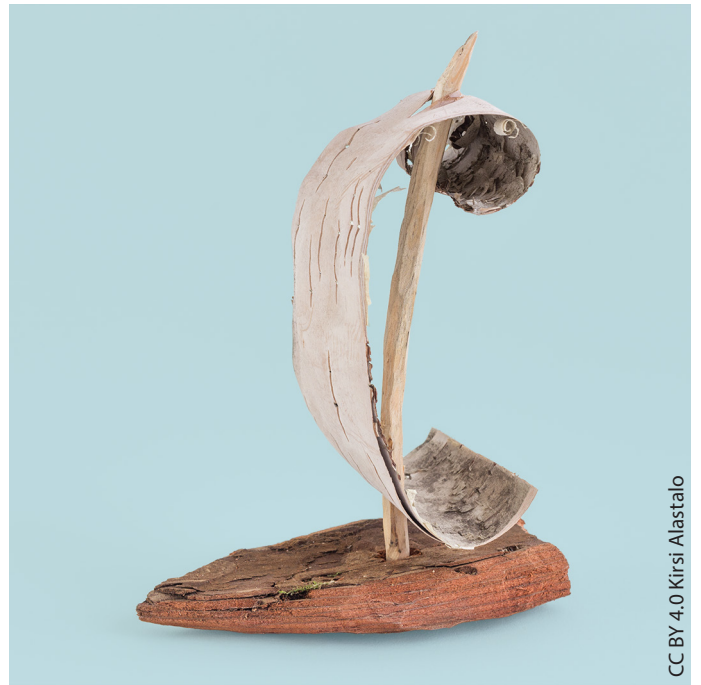
CC BY 4.0 Kirsi Alastalo